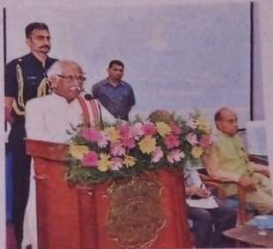
సమావేశంలో మాట్లాడుతున్న గవర్నర్ బండారు దత్తాత్రేయ

పర్యానా గవర్నర్ బండారు దత్తాత్రేయ ప్రశంస