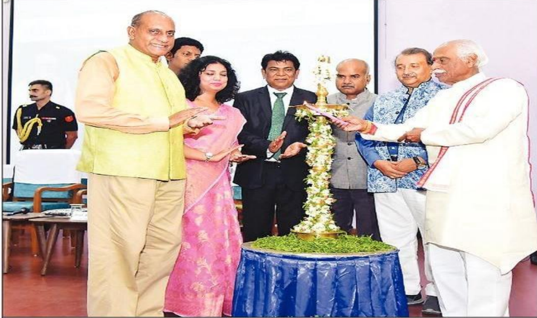
राष्ट्रीय ग्रामीण विकास और पंचायती राज संस्थान, हैदराबाद में पाँच दिवसीय क्षेत्रीय क्षमता विकास प्रशिक्षण कार्यक्रम का उद्घाटन करते हरियाणा के राज्यपाल बंडारू दत्तात्रेय।